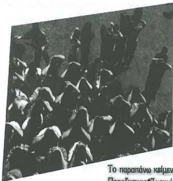
Το παραπάνω κείμενο είναι από το έντυπο δρόμου Παροξυσμός#7, χειμώνας 2003. Εδώ παρουσιάζεται με κάποιες διορθώσεις και κάποιες επιπλέον προσθήκες.

η μηχανισμοί που επιβάλλουν την υποταγή σε μία αβίωτη ζωή είναι ίδιοι και για τους ντόπιους και για τους “ξένους”